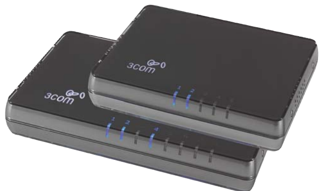
위에서부터: 3Com Switch 5, 3Com Switch 8

운영 체제 독립성 네트워크의 추가적인 구성 없이 네트워크 내에서 서로 다른 운영 체제의 통합을 지원합니다.